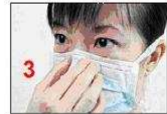
Fix the metallic strip securely over the bridge of the nose