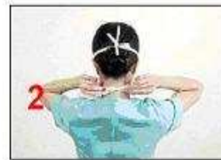
Tie the lower strings at the back of the neck