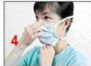
Ensure that the mask fully cover the nose, mouth and is stretched gently over the chin and fit snugly over the face