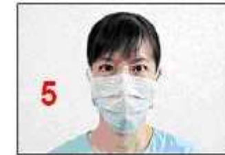
Change mask if it becomes moist or damaged