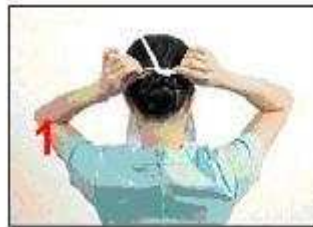
Tie the upper strings at the top of the head