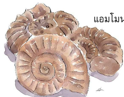
แอมโมนอยด์

ในช่วงมหายุคนี้ ซีกตะวันตกของประเทศไทยยังคงเป็นทะเลน้ำตื้น มีการสะสมตัวของหินปูนและหินตะกอนอื่นๆ จากยุคไทรแอสสิก ต่อเนื่องถึงยุคจูแรสสิก เช่น หินปูน หินดินดาน ที่ลำปาง ตาก ซึ่งใน หินกลุ่มนี้ พบซากดึกดำบรรพ์จำนวนมาก เช่น หอยตะเกียง (brachiopod) และแอมโมนอยด์ (ammonoid) ส่วนซีกตะวันออกของ ประเทศเป็นแผ่นดิน มีการสะสมตัวของตะกอนแม่น้ำ เป็นพวกหินทราย และหินดินดาน และพบซากไดโนเสาร์ จระเข้ เต่า ปลา น้ำจืด ไม่กี่กลายเป็นหิน ฯลฯ ในหินชั้นต่างๆ ที่พบในมหายุคนี้